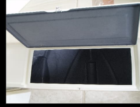
Baş Altı Dolabı

Gömme Bardaklıklar Pilot Konsol Camı Pilot Konsol Cam Korkuluğu PE Benzin Deposu (100 lt) Ahşap Gömme Eşya Yuvaları Yatarlı Silyon Lambası Marin Klakson Switch Panel (12 volt) Kemerli Akü Altlığı Gelcoat Renk Seçenekleri