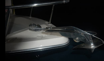
Irgat + Çapa + Zincir (Ops.)