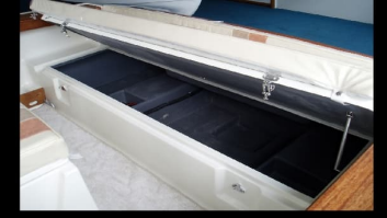
Arka Koltuk Alt Dolabı