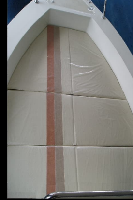
Baş Üstü Güneşlenme