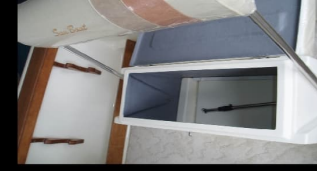
Pilot Koltuk Alt Dolabı