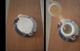
Gömme Kamış Yuvası (Ops.)